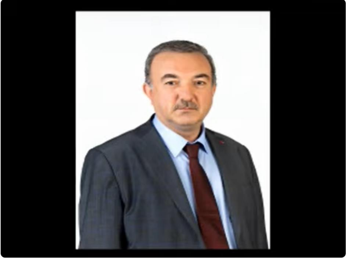
Yardımlaşma (TRT Erzurum Radyosu)/Prof.Dr. Musa Bilgiz