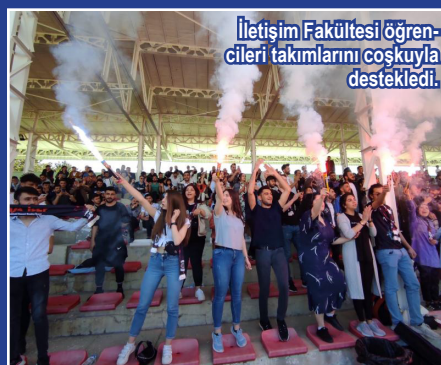
İletişim Fakültesi öğrencileri takımlarını coşkuyla destekledi.

Bitiş düdüğünün ardından fakülte takımı oyuncularını ve teknik sorumlular galibiyeti ve şampiyonluğu kutladılar.