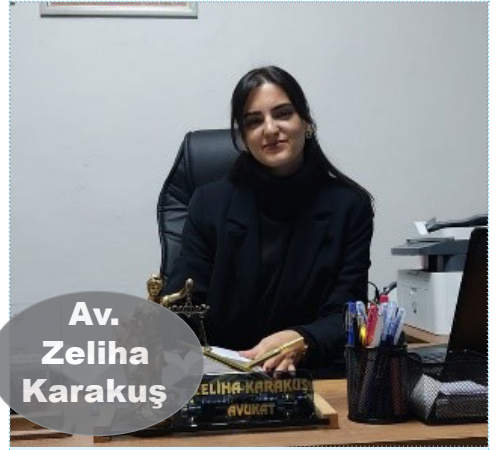
Av. Zeliha Karakuş

"Dünyada en çok estetik ameliyatı yapılan burun, ikincisi yağ almalar, karın germe. Şu an ameliyatsız estetikler daha ilgi görüyor. Botoks, dolgular ve saç ekimi sayısı iyice arttı. Estetikte hızlı bir ilerleme var; sonunu biz de kestiremiyoruz" şeklinde konuşan Köse'ye göre, çağımızın vebasız fazla kilolar da estetiğe zorluyor insanları. Herkes yağ aldırarak, gıdısını yaptırmak, yüzünü gerdirmek istiyor fakat bunları yaparken ucuzu tercih ettikleri için hayatlarından olanlar oluyor. Hayranı olduğu ünlüye benzemek için sayısız ameliyat olanlar var. Sonuçları hep hüsrana oluyor böylelerinin; çoğunun yüzü bakılmaz halde. Aslında bu insanların derdi kendisiyle. Operasyondan sonra yine benzemediklerini anlayınca bağımlı hale geliyorlar. Oysa estetiğin de bir sınırı olmalı ve bunlar da ilgili kurumlarca denetlenmeli. Gerçek doktor olmayanlar insanları parasıyla rezil edebiliyor.