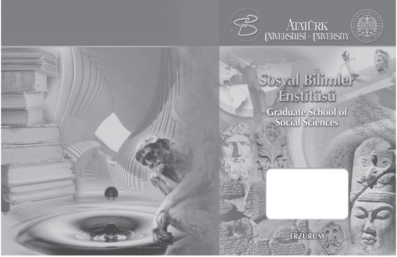
Doktora Tez Kapağı